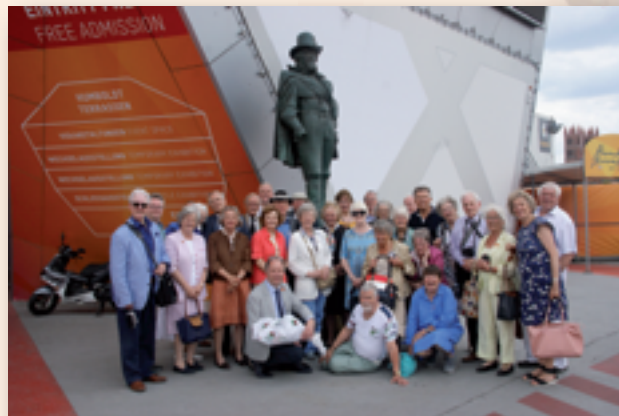
Groepsfoto bij het Humboldt Forum

De verenigingsreis naar Polen en Berlijn van 18 juni tot en met 24 juni 2018 stond weer in het teken van Oranje en Pruisen in de 19e eeuw. Historizon regelde de bus, de hotels en de dagelijkse lunches en diners. De reis ging via Braunschweig naar Polen, waar we hotel Racot met stoeterij bezichtigden. Erfprins Willem Frederik kocht Racot in 1798 en het vererfde uiteindelijk op de groothertogen van Saksen-Weimar-Eisenach. De volgende dag een bezoek aan kindersanatorium Wojnowo, het Reckenwalde waar prins Bernhard zijn jeugd doorbracht. In het nabijgelegen Trzebiechow, ooit Trebschen, stichtte Marie Anna Alexandrine Sophie van Reuss