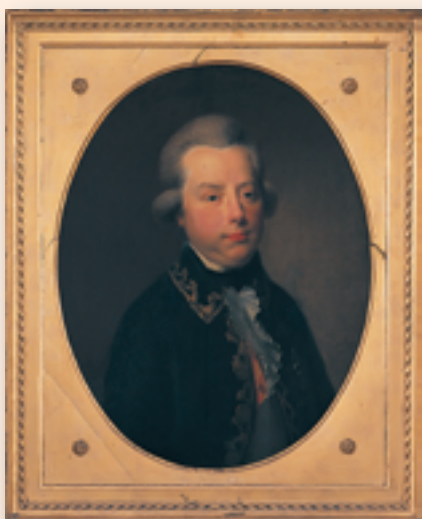
Johan Friedrich August Tischbein (1750-1812, Portret van Willem V, prins van Oranje (1748-1806))

In Rijksmuseum Twenthe in Enschede zal van 8 september 2019 t/m 20 januari 2020 de tentoonstelling J.F.A. Tischbein. Pionier van de Duitse romantiek plaatsvinden. Wij lenen voor deze