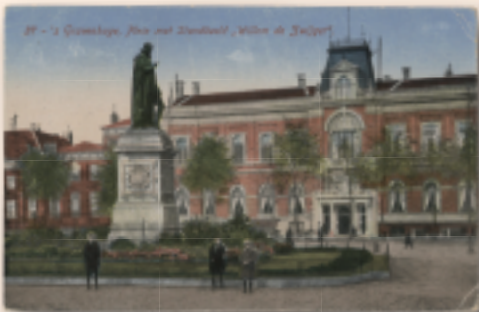
Prentbriefkaart in kleur, ca. 1915.

Op zaterdag 13 april organiseert het Haags Gemeentearchief, samen met 30 andere cultuur-historische erfgoedinstellingen in Den Haag, de Dag van de Haagse Geschiedenis. Deze dag vindt plaats op en rond het Plein en ieder jaar belichten we voor ons publiek een stukje omgeving. Dit jaar bouwen we een stelling rondom het standbeeld van Willem van Oranje dat al sinds 1848 op het Plein staat. Het publiek kan de stelling op en zo oog in oog met Willem van Oranje komen. Het is interessant om te zien hoe de ontwerper van het beeld rekening heeft gehouden met het perspectief. Hij wist immers dat het standbeeld van onderaf bekeken zou worden. Als je oog in oog komt dan valt op dat hij een relatief klein hoofd heeft en enorme voeten.